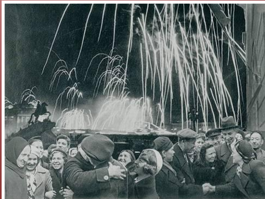
«Великая победа одержана советскими войсками под Ленинградом»

Победе радовалась вся страна, но эта радость была со слезами на глазах, так как в каждой семье, в каждом доме кто-то погиб на этой страшной войне.